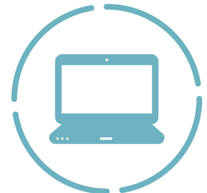
Webinaire PNDS "Amyloses cardiaques"