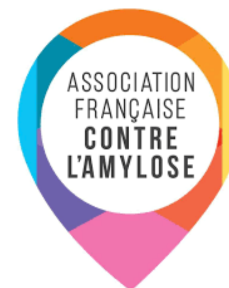
Association membre de la filière Cardiogen

Rendez-vous pour la 12e édition des Journées annuelles nationales de la filière, les 2 & 3 avril 2026 à Toulouse ! Réservées aux professionnels de santé