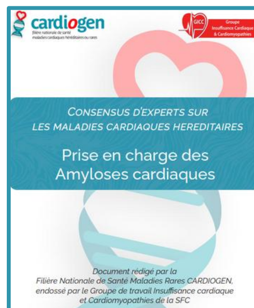
Consensus d'experts "Prise en charge des amyloses cardiaques"

Filière nationale de santé maladies cardiaques héréditaires ou rares