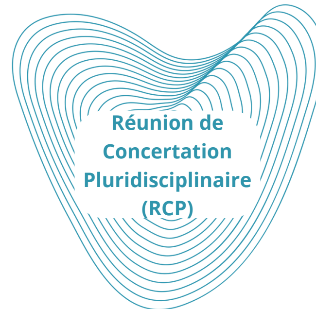
RCP nationale de recours "Amyloses cardiaques"