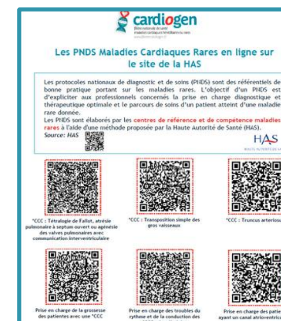
Protocole National de Diagnostic et de Soins "Amyloses cardiaques"